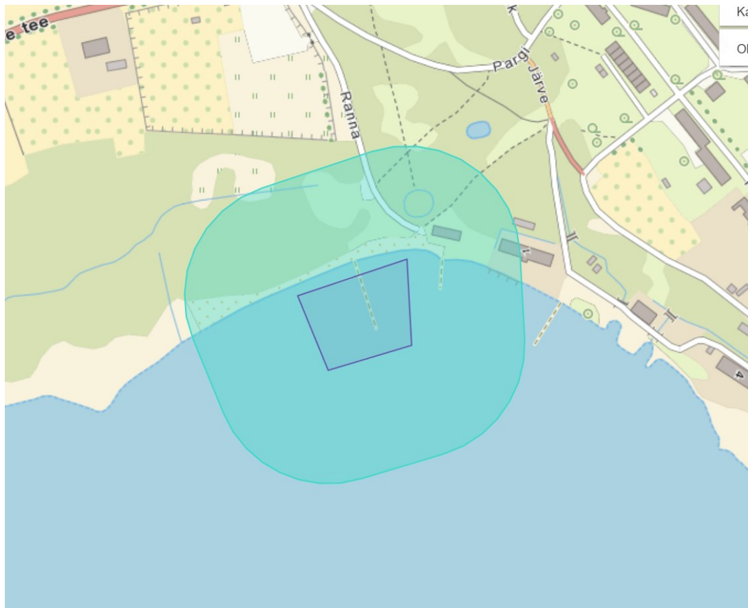
Joonis. Kuremaa järve ujumikoha asukoht

KMH viiakse läbi keskkonnaloa (tegevusloa) andmise üle otsuse tegemiseks, sh loatingimuste määramiseks. KMH käigus hinnatakse kavandatava tegevuse ja selle alternatiivide mõju keskkonnale, tuuakse välja selle olulisus ning võimalikud leevendusmeetmed negatiivse mõju vähendamiseks või vältimiseks. Keskkonnamõju hindab KMH juhtekspert ja eksperdirühm koos arendajaga.